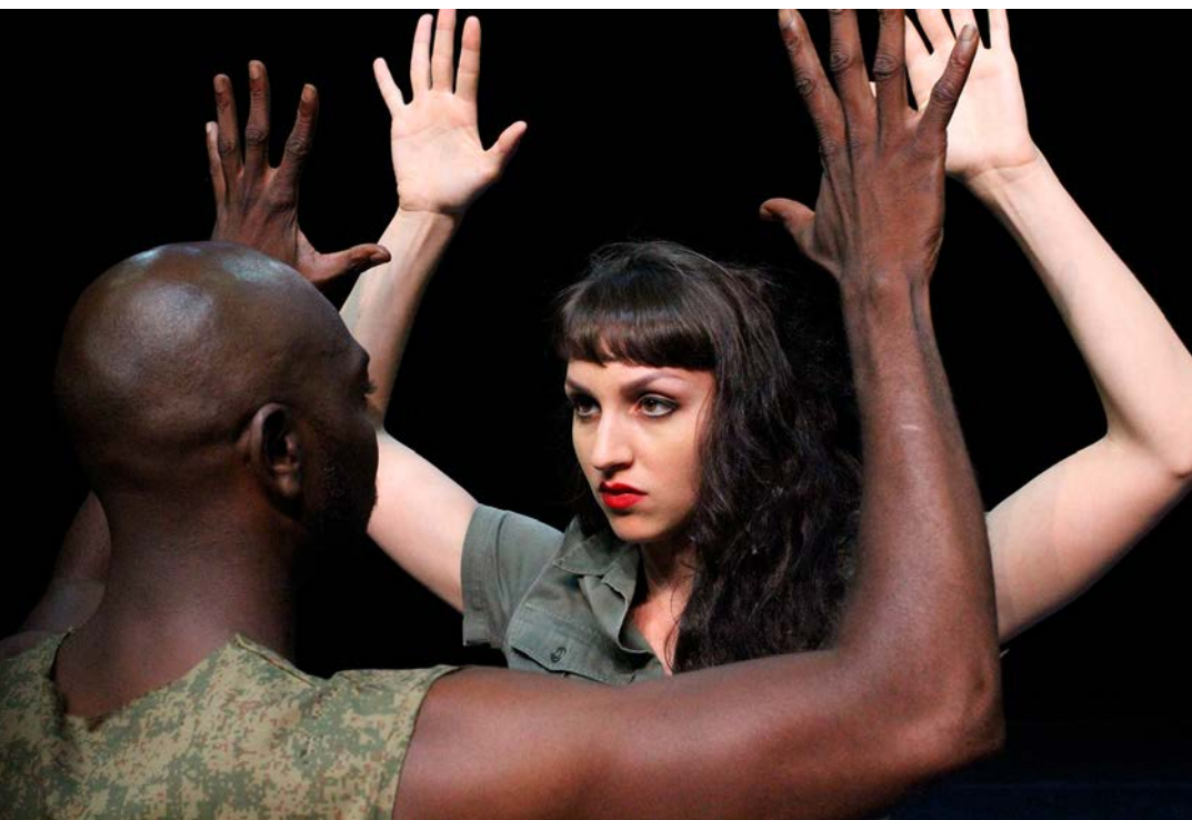
Spectacle My Rock

Inviter les élèves à reproduire le plus fidèlement la posture et à l'intégrer dans un mouvement avec un début et une fin. L'intérêt pour les élèves est de s'approprier une mini-séquence et de la mémoriser corporellement en action. Cette séquence prépare la proposition suivante.