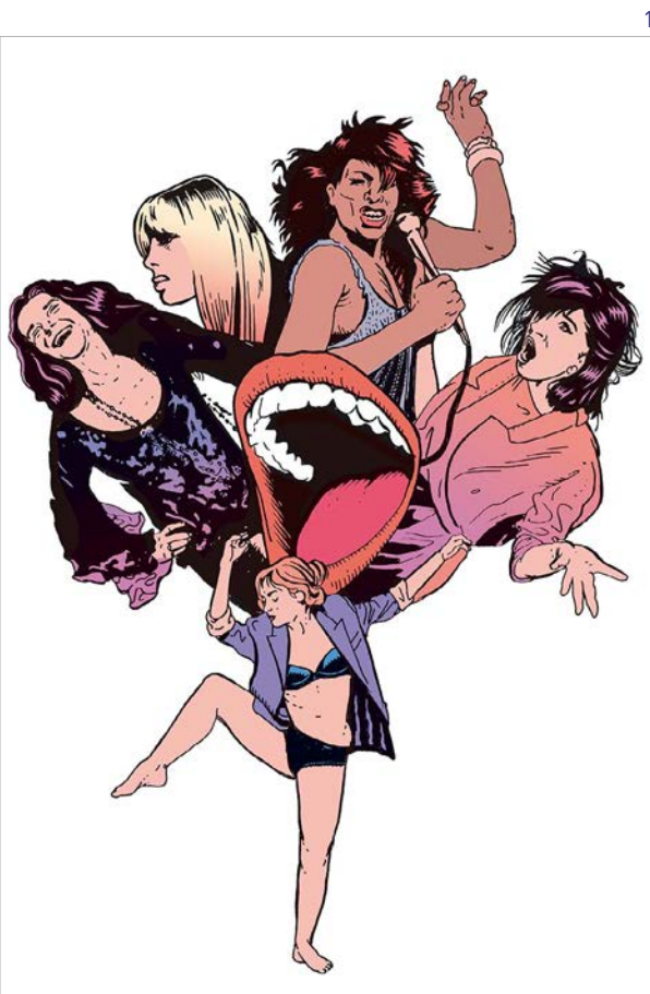
1 : Affiche du spectacle © Stéphane Trapier 2 : Photo de My Rock © Giovanni Cittadini Cesi

Le contraste de ces deux visuels nous raconte une partie de l'histoire de ces femmes rockeuses, pleines d'une énergie de joie, de rage et d'insouciance mais également de fins parfois tragiques.