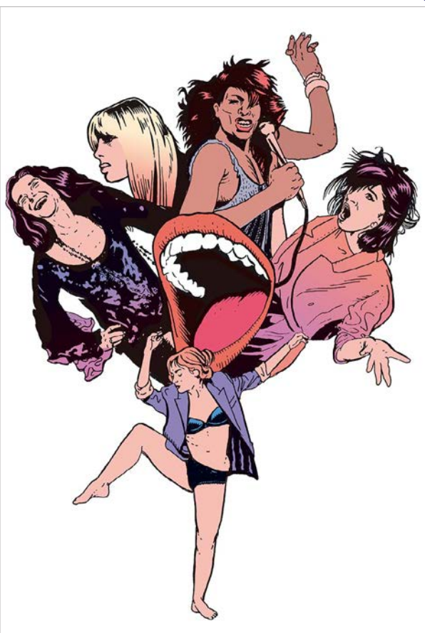
1 : Affiche du spectacle © Stéphane Trapier 2 : Photo de My Rock © Giovanni Cittadini Cesi