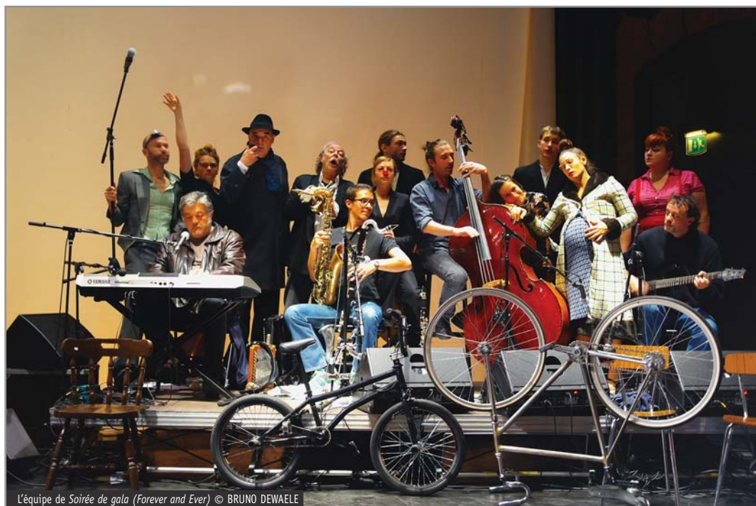
L'équipe de Soirée de gala (Forever and Ever)