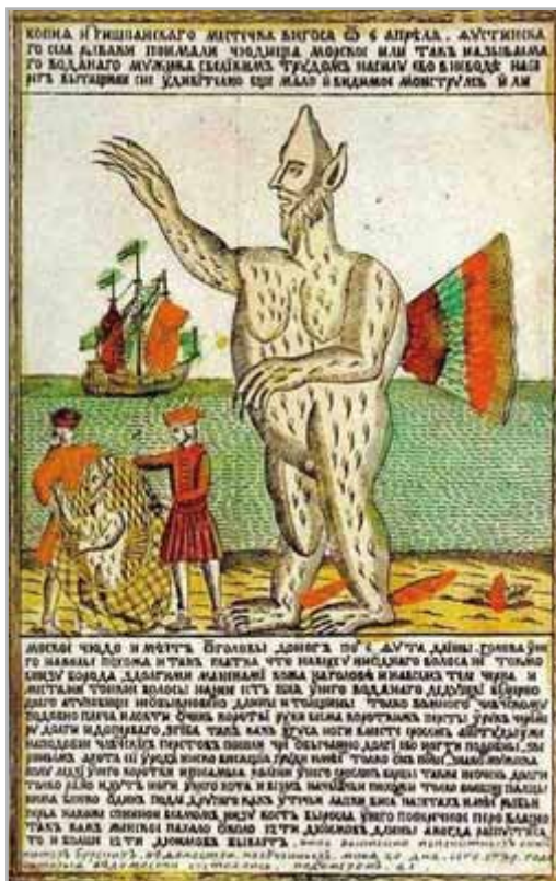
EXEMPLE DE LOUBOK

Un espace, des personnages, une action: l'affiche est en elle-même un véritable matériau dramatique. Comme une miniature de la pièce.